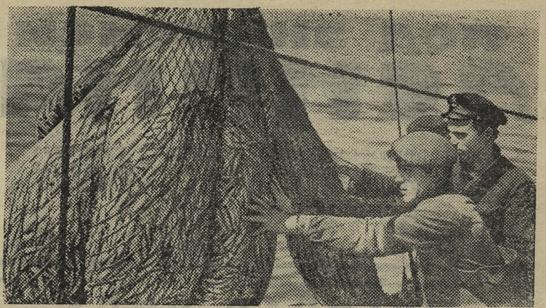
ЛИТОВСКАЯ ССР. Работники рыбной промышленности республики с огромным интересом встретили Постановление ЦК КПСС и Совета Министров СССР «О мерах по увеличению добычи рыбы и производства рыбной продукции».

Предложено секретарям партийных организаций больше уделять внимания лекционной пропаганде, улучшить работу лекторских групп предприятий и членов общества по распространению политических и научных знаний. На партийных бюро и парткомах в июле—августе обсудить постановление ЦК КПСС «О руководстве Куйбышевского обкома партии идеологической работой» и наметить мероприятия по улучшению состояния этой работы у себя.