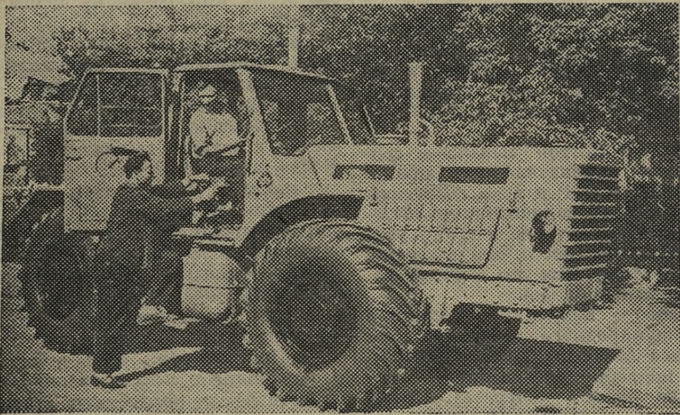
УКРАИНСКАЯ ССР. На заводскую обкатку из экспериментального цеха Харьковского тракторного завода вышли опытные образцы мощных колесных тракторов «Т-125» с дизельным двигателем в 130 лошадиных сил.