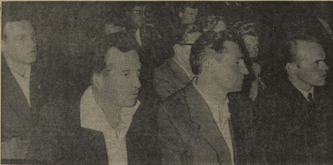
★ Участники заседания слу- шают доклад.

Несомненно, проведенное совещание будет способствовать улучшению работы предприятия, успешному выполнению государственного плана четвертого года семилетки, повысит роль инженеров и техников на производстве.