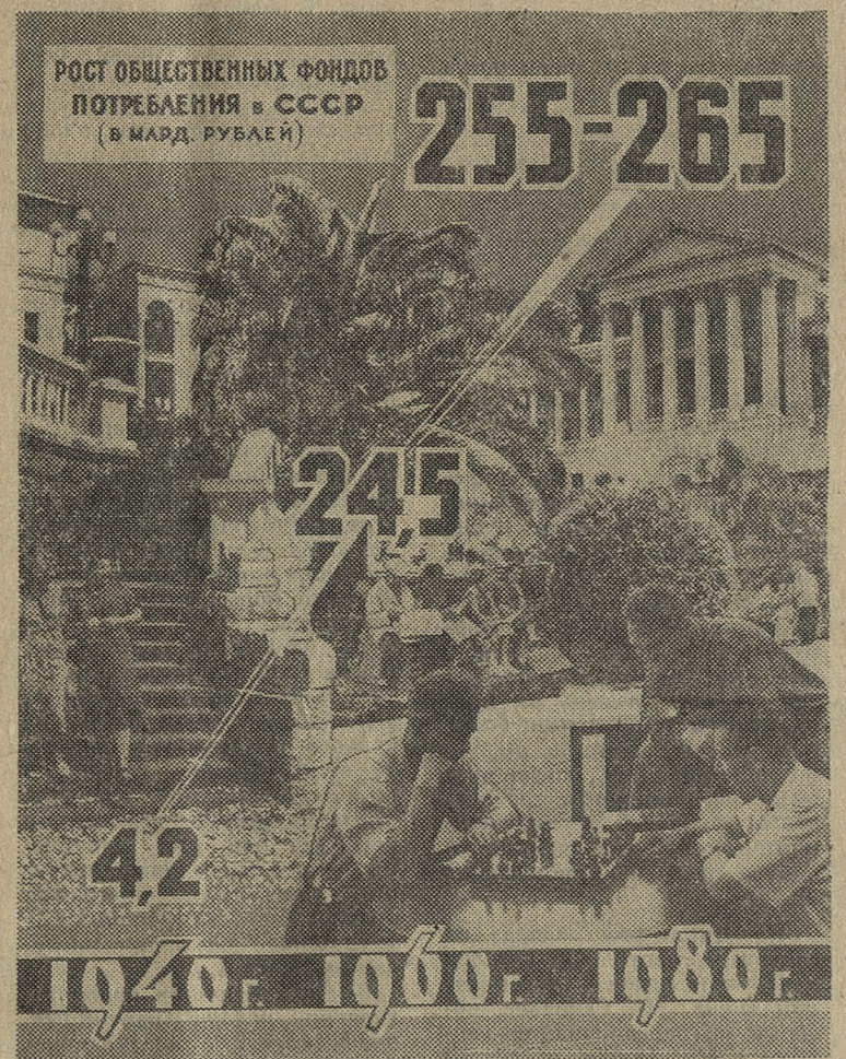
Таким образом, перед лицом всего мира Советское государство являет пример действительно полного и всеобъемлющего удовлетворения растущих материальных и культурных потребностей человека.