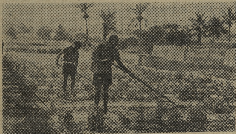
РЕСПУБЛИКА Сенегал. Около 95 процентов населения страны занято в сельском хозяйстве.

5 июня по приглашению Советского правительства председатель Совета Министров и министр национальной обороны Республики Сенегал Мамаду Диа прибыл в Советский Союз с официальным визитом.