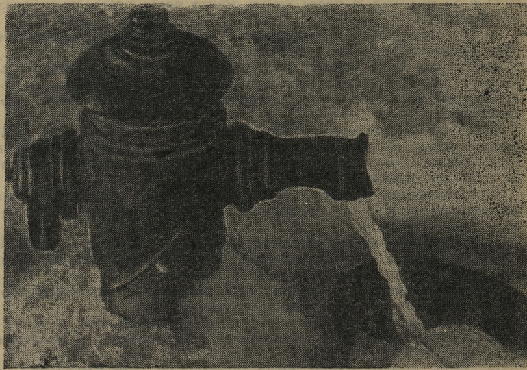
Эта колонка установлена на углу улиц Колхозная и Советская. Очень часто можно видеть ее в неисправном состоянии. Вода не престанно течет...