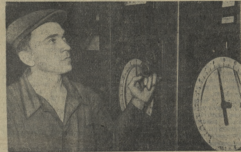
НА СТРОИТЕЛЬНЫХ УЧАСТКАХ ГОРОДА

Коллектив участка «Уралэлектромонтаж» обязался сдать в эксплуатацию комплекс цеха № 8 во втором квартале 1962 года. Для этого необходима техническая документация по всему комплексу, на основании которой можно составить проект организации работ. Однако в настоящее время нет полной ясности по сметам, т. к. ранее выданные сметы по печному отделению, по корпусу бихромата натрия и складу соды не охватывают всего объема работ. По печному отделению выявлено, что физические объемы увеличились в связи с измененными «Уралгипрохимом», чертежами примерно на 40—50 процентов за счет добавления технологического оборудования неучтенного проектом.