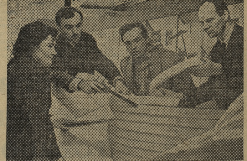
МОСКВА. На реке Ингури в Грузинской ССР в настоящее время строится высоконапорная гидроэлектростанция мощностью 1,6 миллиона киловатт, арочная плотина которой достигнет 300-метровой высоты (до сих пор наиболее высокой считается плотина в 266 метров в Италии).

На стройке варварски относятся к оборудованию. Хромниковское стройуправление электро-