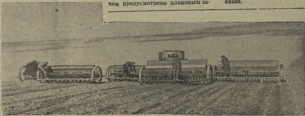
Цех № 8 Хромпика — к сроку!

УЗБЕКСКАЯ ССР. Сев ячменя в совхозе «Галла-Арал» № 1 Самаркандской области.