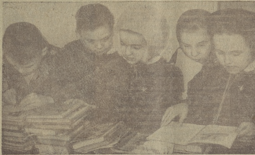
Ой, какие книжки интересные!