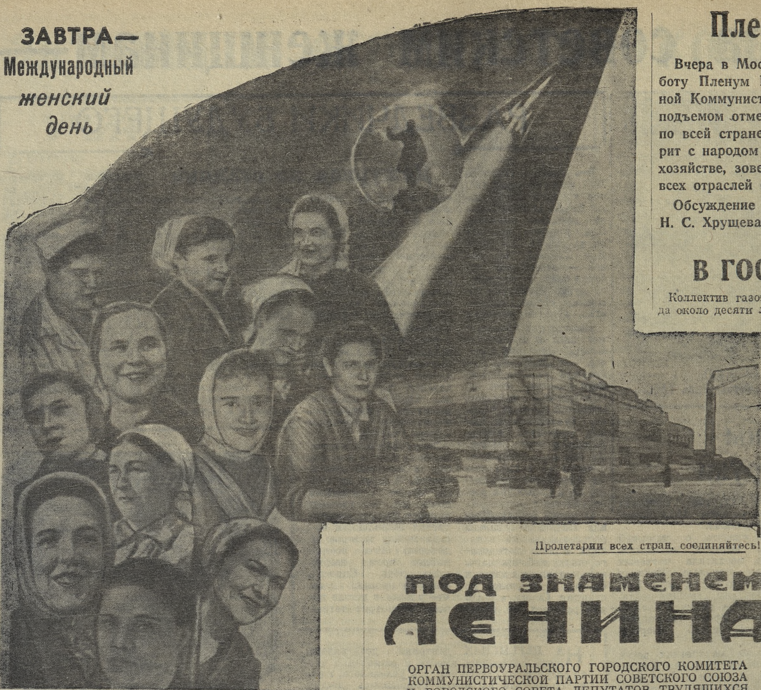
Пролетарии всех стран, соединитесь!