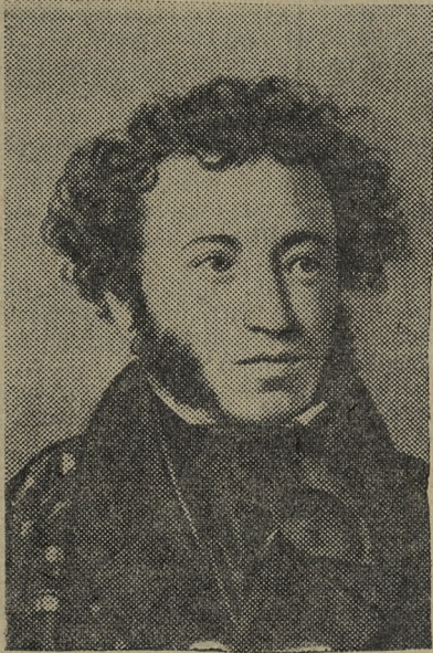
Александр Сергеевич Пушкин. (1799—1837).

В Пушкине нас покоряет глубокое чувство национальной гордости. В годы мракобесия и бесправия поэт горячо верил в неисчерпаемые силы русского народа, в высокое назначение своей родины. И в то же время ему была чужда национальная ограничен-