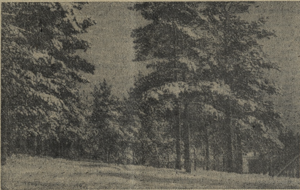
Тихо в заснеженном лесу...