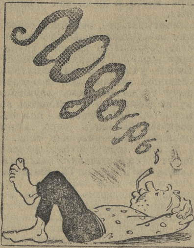
Рис. А. ГРУНИНА.

Не вышел человек на работу без уважительной причины на участке или в цехе — тревога. Рабочий суд — самый строгий суд. Он не дает в обиду безвиновного, но и виновному не позволяет уйти от ответственности. Когда в руки общественности будет отдано дело разбора нарушителей трудовой дисциплины, тогда и самих нарушителей будет меньше. Такой суд не только будет очищать рабочую семью от моральных уродов, но и воспитывать их.