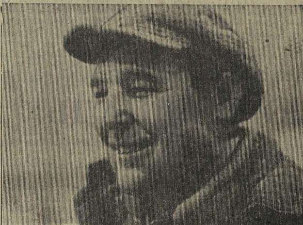
Решающие дни на строительстве цеха В-1А Новотрубного завода

От правильщиков не отстают и резчики Т. Е. Ря-