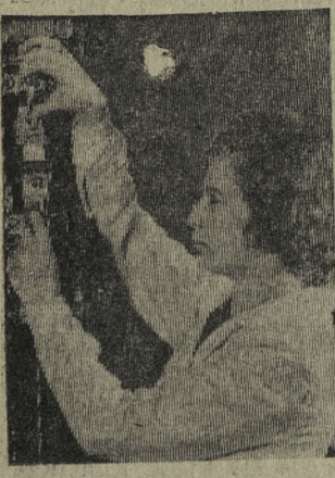
МОСКВА. Во Всесоюзном проектно-конструкторском и технологическом институте мебели ведется работа по изысканию новых пластических материалов для производства мебели и разработки технологических процессов, связанных с их применением.