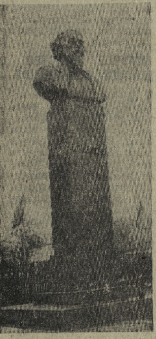
На родине Н. А. Некрасова в г. Немирове (Винницкая область) в связи со значительной датой состоялось торжественное открытие памятника великому русскому поэту.