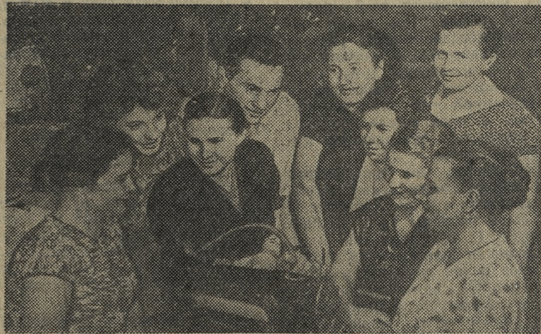
ЛЕНИНГРАД. Коллектив цеха коммунистического труда обувного гиганта фабрики «Скорход» успешно трудится в новом году.