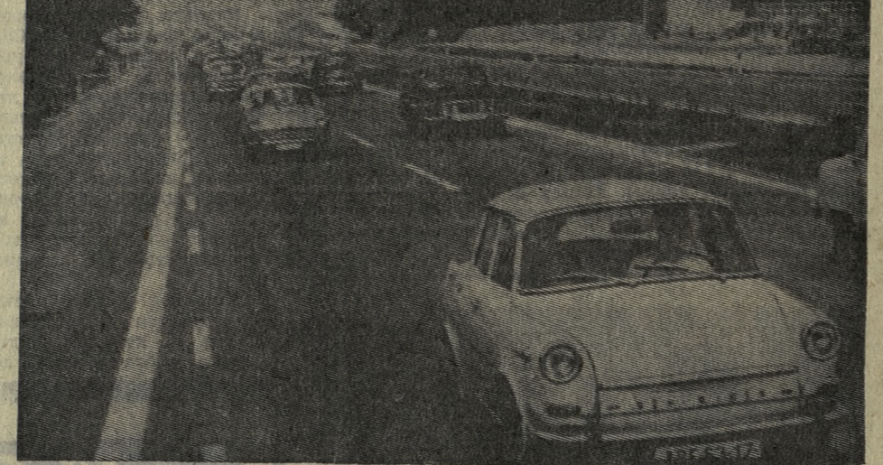
Мир в объективе фотожурналиста

Новая магистраль пройдет через такие крупные экономические центры страны, как Прага, Ягелла, Брно, Братислава. Сооружение дороги ведется с учетом всех требований современного скоростного транспорта.