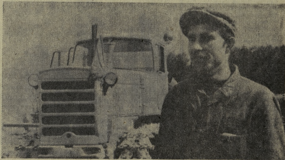
В ГОРОДСКОМ КОМИТЕТЕ НАРОДНОГО КОНТРОЛЯ