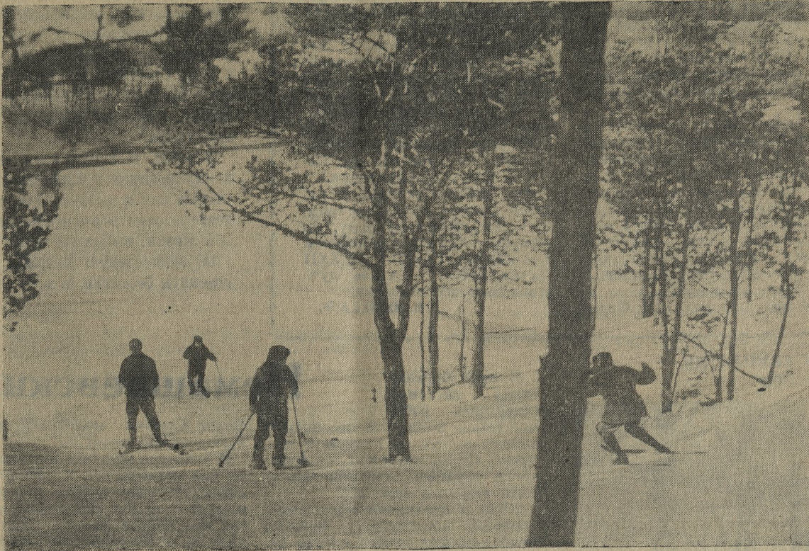
Загледелись мальчишки: вот здорово получается!

3 ЯНВАРЯ у кассы клуба Металлургов была очередь. Небольшая, непрерывная очередь. В кино? Нет, на лекцию. Не верите? Да, на лекцию. Предметом столь большого интереса была тема лекции «Ракетное оружие». Ракеты мирные и ракеты боевые — наша современность. В наши дни появились Гагарин и Титов, мы — очевидцы первых сигналов из космоса, посланных человеком. И вот наступил новый 1962 год. Что можно ожидать в нем, насколько человек продвинется в космос и каковы же планы укрепления нашей оборо-