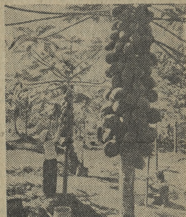
Китайская Народная Республика. На плантации папайи (дынное дерево) в провинции Юньнань.