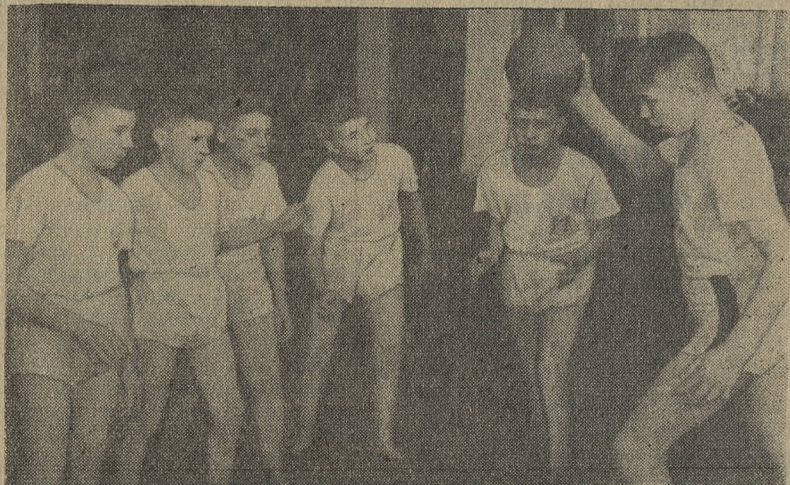
В школе-интернате систематически работает баскетбольная секция. Ребята тренируются очень серьезно и есть у них мечта — занять первое место среди школьных команд города.