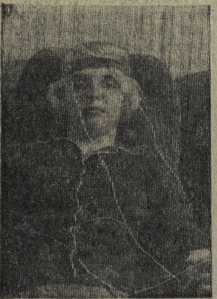
В Московском научно-исследовательском институте гигиены имени Ф. Ф. Эрисмана изучаются проблемы производственной и жилищной гигиены.

Как вдыхает шум на организм человека? Какие его допустимые пределы? Как лучше организовать питание людей различных возрастов? Какие безопасные для здоровья нормы загрязнения воздуха на предприятиях? — вот часть их вопросов, которые беспокоят сегодня ученых. Их успешное разрешение улучшит условия труда на фабриках и заводах.