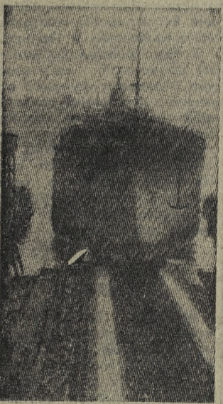
«Герлена» — так называется новый рудовоз, построенный по заказу норвежской фирмы «Геррардс Редери» на Балтийском заводе в Ленинграде. Название судна составлено из начальных слогов названия фирмы, являющейся заказчиком, и города, где построен корабль (Ленинград).

Новый рудовоз — очередное судно, изготовленное заводом на экспорт. В настоящее время под шведским флагом бороздят моря и океаны изготовленные ленинградскими судостроителями рудовозы «Ринголетто», «Травата», «Мадам Баттерфляй».