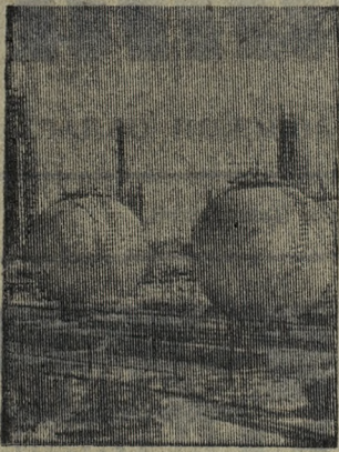
АЗЕРБАЙДЖАНСКАЯ ССР. Ново-Бакинский нефтеперерабатывающий завод имени Владимира Ильича, награжденный недавно орденом Октябрьской Революции, с начала года сверх плана выработал на сотни тысяч рублей нефтепродуктов. Этот успех достигнут благодаря умелому использованию действующего оборудования.

На снимке: вид на один из участков завода.