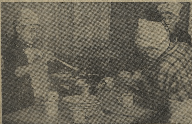
Снимок № 4.

«ПОД ЗНАМЕНЕМ ЛЕНИНА» 7 января 1962 г. 3 стр.