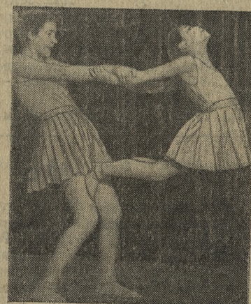
Снимок № 5.

Все шире и крепче завязывается дружба между воспитанниками интерната и рабочими города. Сейчас уже пять классов имеют взрослых друзей с Новотрубного завода и из треста «Уралтяжтрубстрой». Особенно желан-