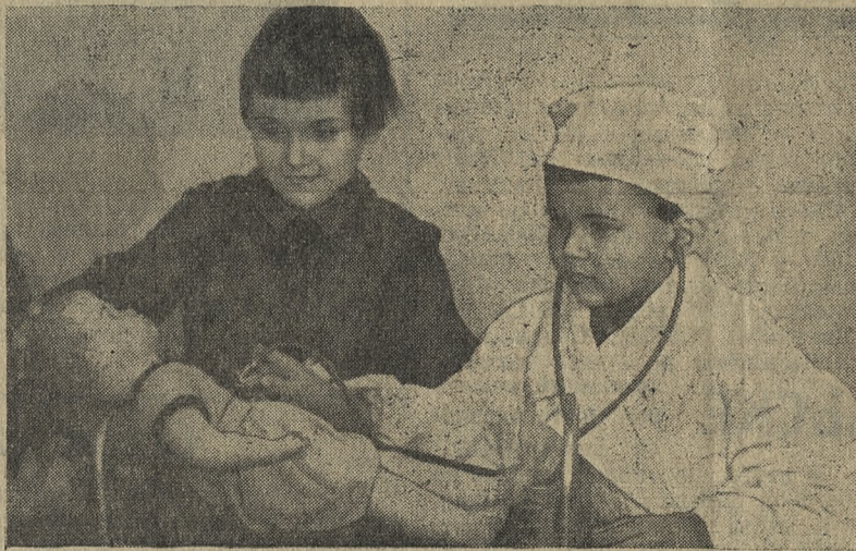
Снимок № 3.