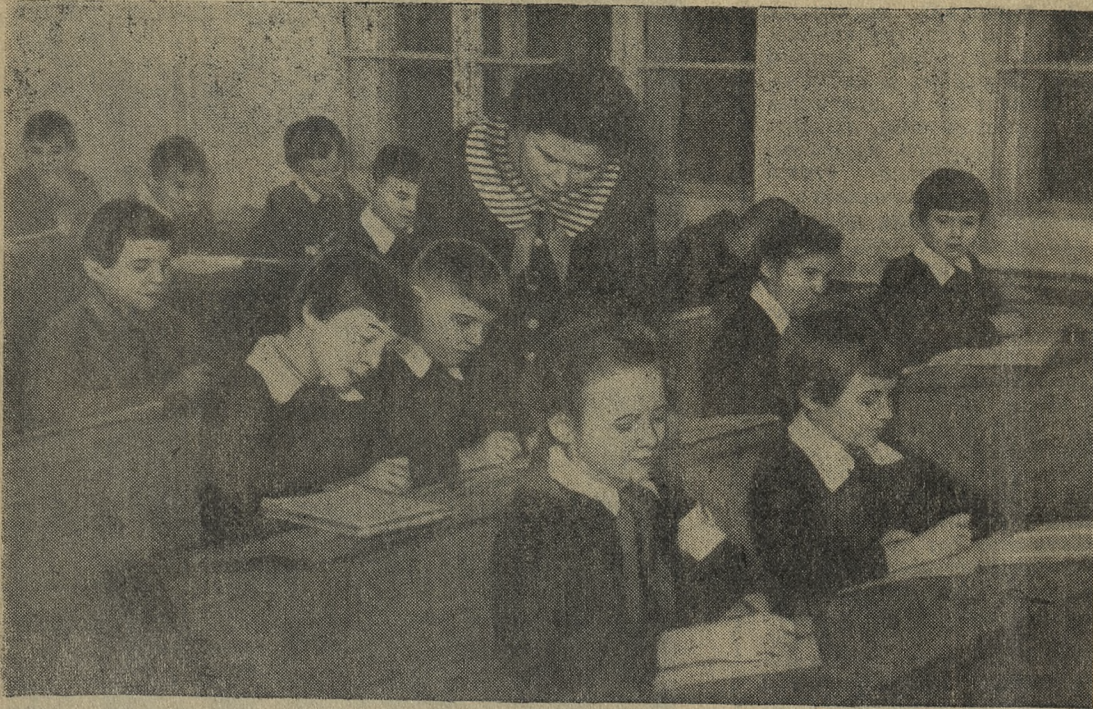
Снимок № 1.

Нынче, 12 апреля первая в нашем городе школа-интернат будет отмечать свою вторую годовщину со дня открытия. Срок еще небольшой, но за это время сделано многое. А самое главное — сплотился коллектив.