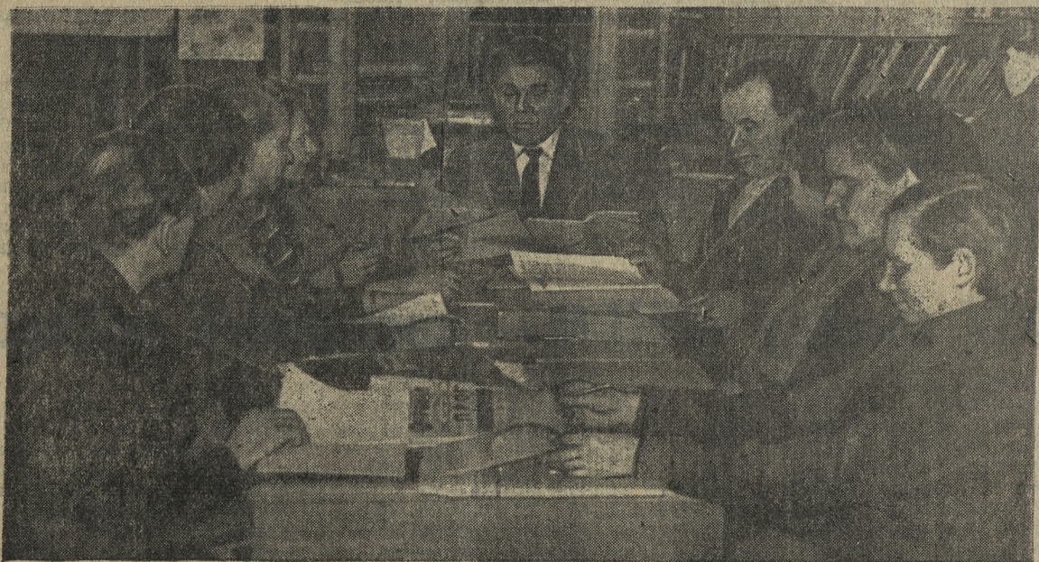
Слушатели семинара конкретной экономики Динасового завода за изучением материалов XXII съезда КПСС.