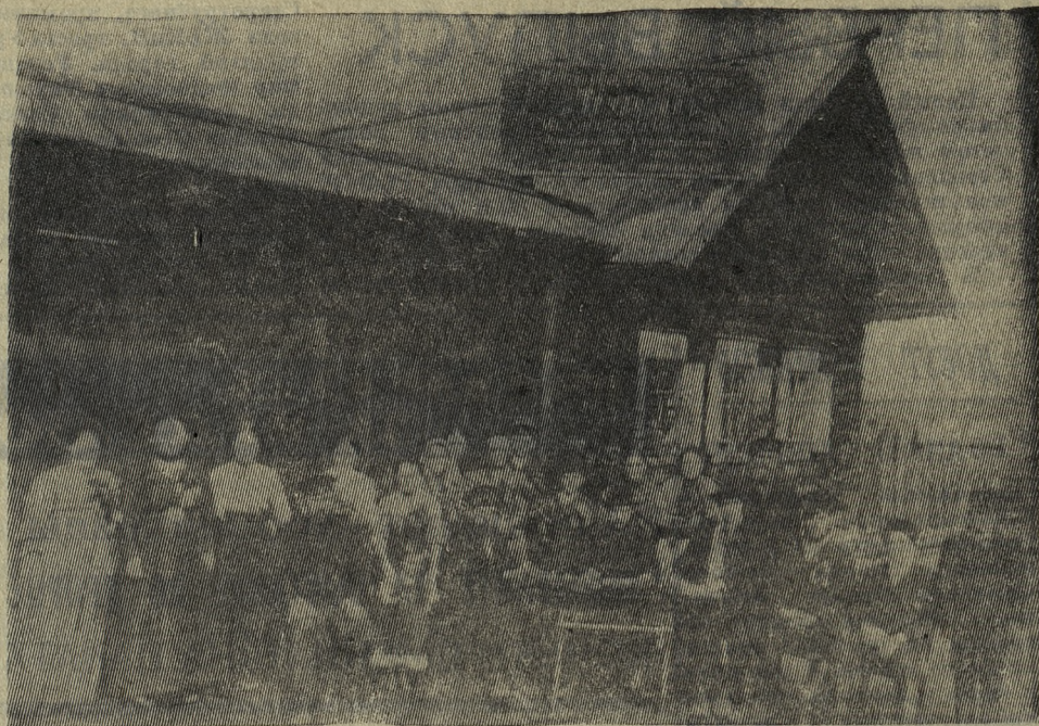
● Из истории родного края