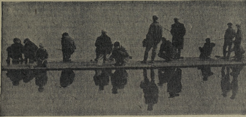
В ожидании поклевки.

ТЕЛЕФОНЫ: редактор — 2-15-72, зам. редактора — 2-52-05, ответственный секретарь — 2-14-94, отдел партийной жизни — 2-52-83, экономический отдел — 2-53-47, отдел писем — 2-52-21, корректорская — 2-35-62, бухгалтер — 2-53-71, директор типографии — 2-46-55.