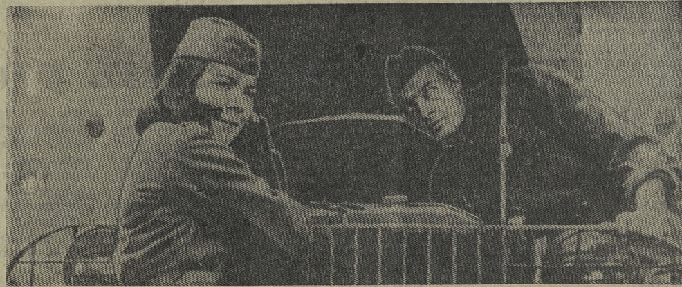
Редактор С. И. ЛЕКАНОВ.