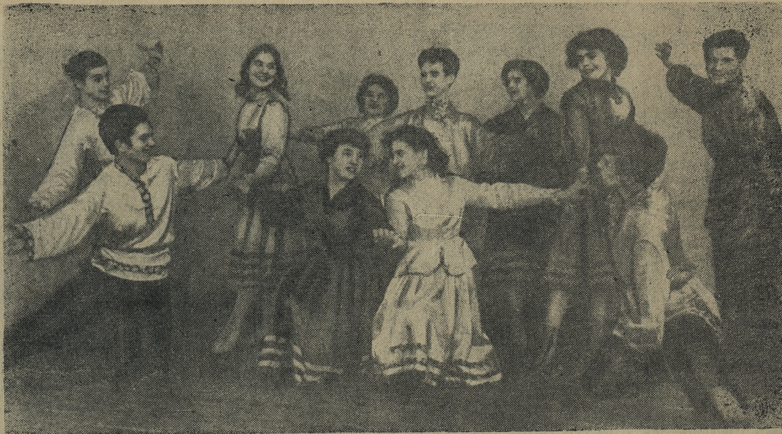
Улыбки, смех, задор, — кажется, сама молодость вышла на сцену. Эту парней и девушек вы увидите на сцене клуба Строителей в новогоднем концерте.