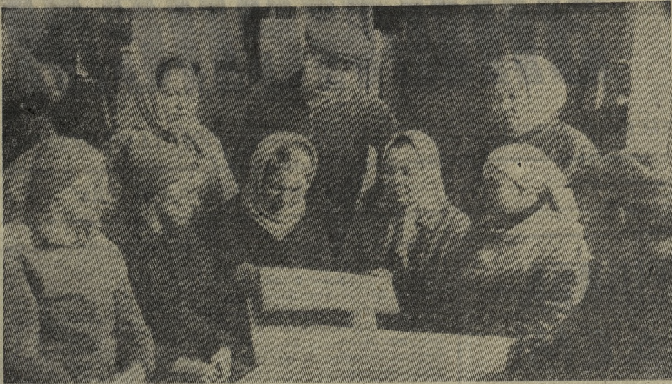
В обеденный перерыв рабочие цеха технологического оборудования собираются вокруг агитаторов, чтобы послушать новости свежего номера газеты. На заводе технологического оборудования такое ознакомление с текущими событиями в стране и за рубежом стало хорошей традицией.

В. ЖАВОРОНКОВА, нештатный корреспондент.