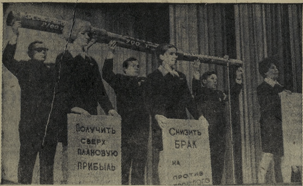
НА ПРИЗ «ПОД ЗНАМЕНОМ ЛЕНИНА»