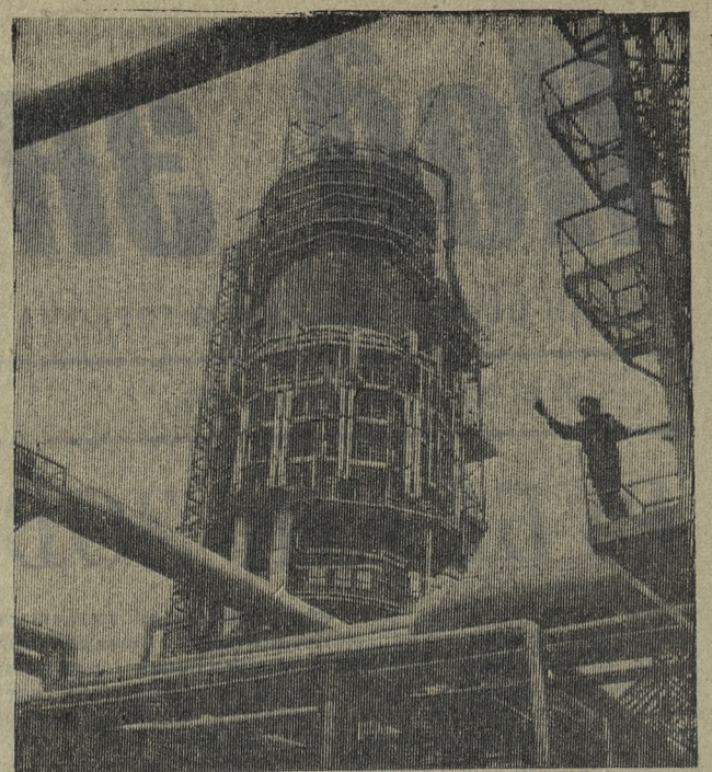
Кременчугский нефтеперерабатывающий завод вырос на Украине за годы минувшей пятилетки. Переработка нефти, которая добывается в восточной части Украинской ССР, ведется здесь тремя наиболее прогрессивными способами: ректификацией, т. е. разделением нефти на фракции, деструкцией углеводородов с помощью установок, носящей название каталитического риформинга, и каталитическим крекингом.