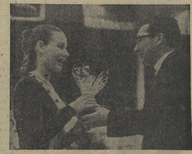
Редактор С. И. ЛЕКАНОВ.

ИЗВЕЩЕНИЕ 11 марта в 10 часов в здании металлургического техникума состоится очередная семинар пропагандистов. Отдел пропаганды и агитации горкома КПСС.