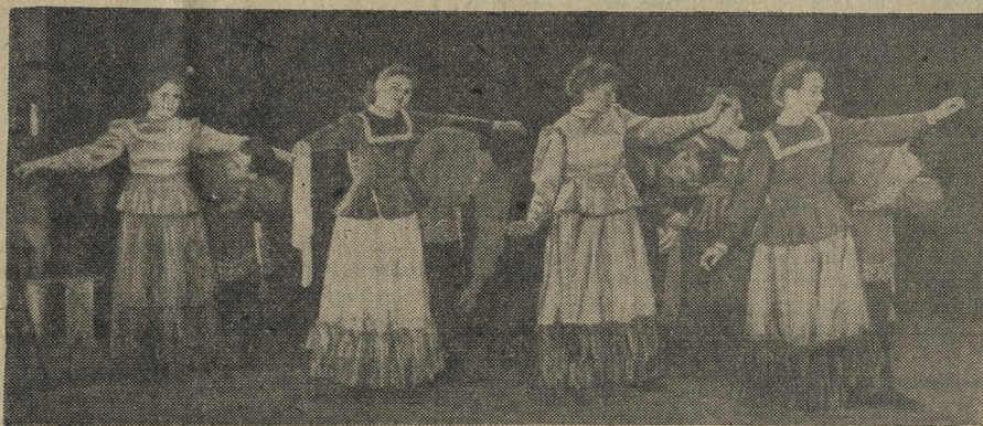
Танцевальный коллектив Дворца культуры Динасового завода готовится к предстоящим новогодним концертам.