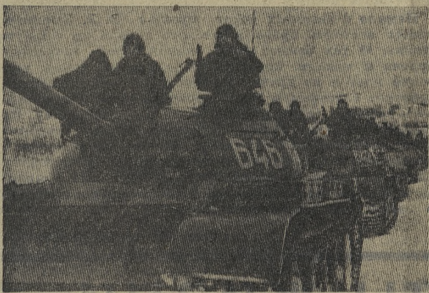
Танковая колонна на марше.