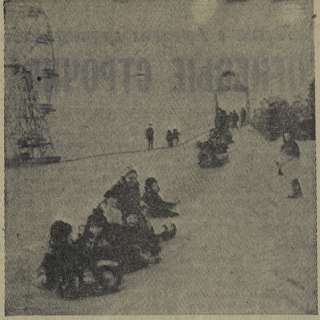
Городской парк — любимое место ребячьих забав: летом кружат малышей расписные карусели, а зимним воскресеньем весело мчатся в санном поезде или с ледяной горки.