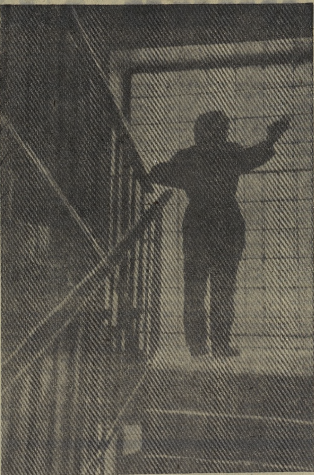
МИР НАШИХ УВЛЕЧЕНИЙ