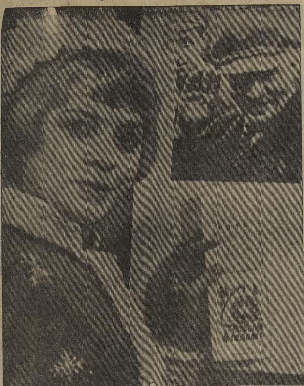
Открываю календарь Начинается январь.