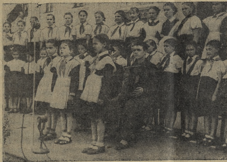
Выступает хор детского сектора Дворца.