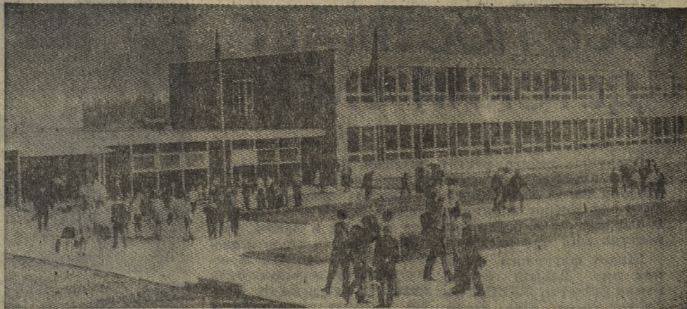
ПРАГА. 45 тысяч юных граждан Чехословакии впервые в этом году переступили порог школьных классов. Во многих районах республики занятия начались в новых учебных зданиях. Только в чешских областях открылось свыше 20 новых школ.