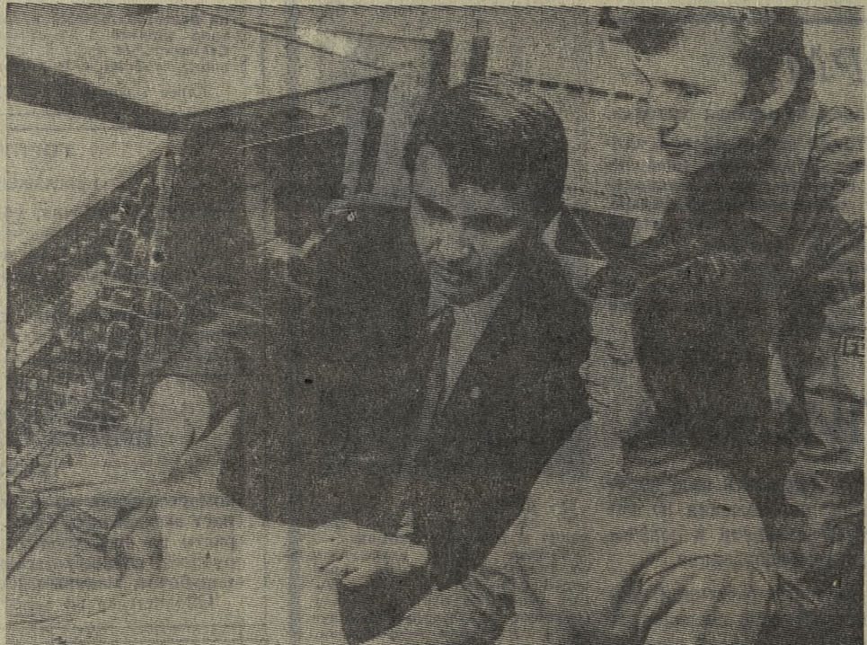
7 ОКТЯБРЯ — ПРОВОЗГЛАШЕНИЕ ГЕРМАНСКОЙ ДЕМОКРАТИЧЕСКОЙ РЕСПУБЛИКИ (1949 г.)