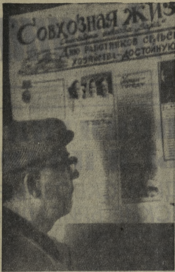
У свежего номера стенной газеты совхоза «Заря», подготовленного рабкорами Новотрубного завода.