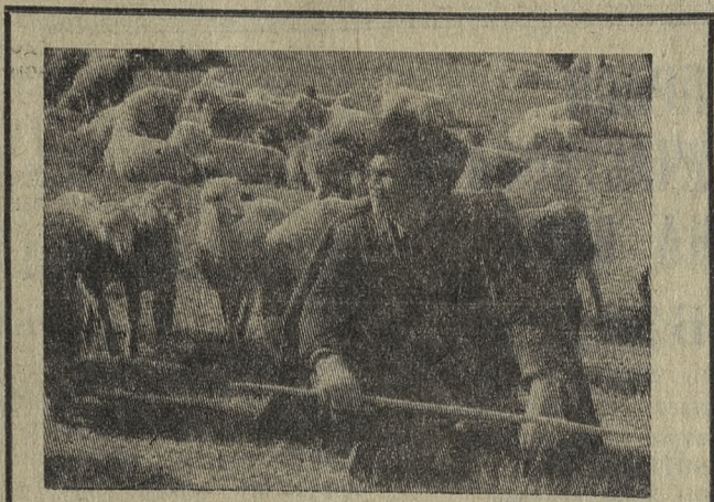
НАВСТРЕЧУ 50-ЛЕТИЮ СОВЕТСКОГО АЗЕРБАЙДЖАНА