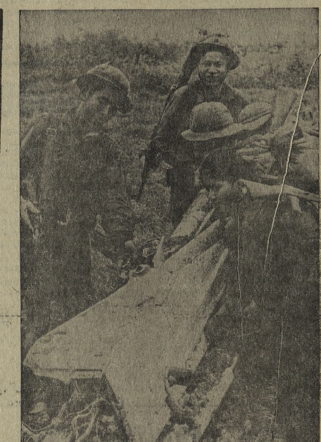
Народные вооруженные силы освободили и партизаны Южного Вьетнама успешно ведут боевые действия против американско-саigonских войск. За 10 дней августа только в провинции Тьен-Хань патриоты уничтожили 600 солдат и сбили 24 самолета и вертолета противника.

На Западе сейчас много говорят об экономических успехах Японии. Действительно, в этом году Япония вышла на второе место в капиталистическом мире по объему валового производства и вскоре собирается давать столько же продукции, сколько Англия и Франция, вместе взятые. Главной сырьевой базой японской промышленности являются страны Азии. В последнее время все более пристальное внимание японского бизнеса привлекает Африканский континент. Это объясняется острой потребностью в сырьевых ресурсах, необходимых для расширения капиталистической экономики страны. Достаточно сказать, что Япония импортирует 88 процентов всей необходимой ей нефти и 88 процентов железной руды. Японские монополии расматривают Черный континент как весьма выгодную и перспективную область сбыта своих товаров. Японский монополистический капитал стремится захватить прочные позиции в нарождающейся промышленности молодых государств. Основная задача японских монополий в Африке — получение доступа к ее богатейшим минеральным ресурсам. 19 японских компаний подписали в марте этого года соглашение с Ни-