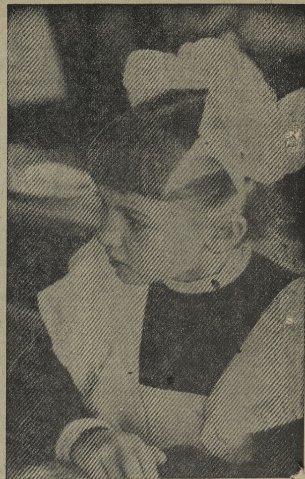
На первом уроке.