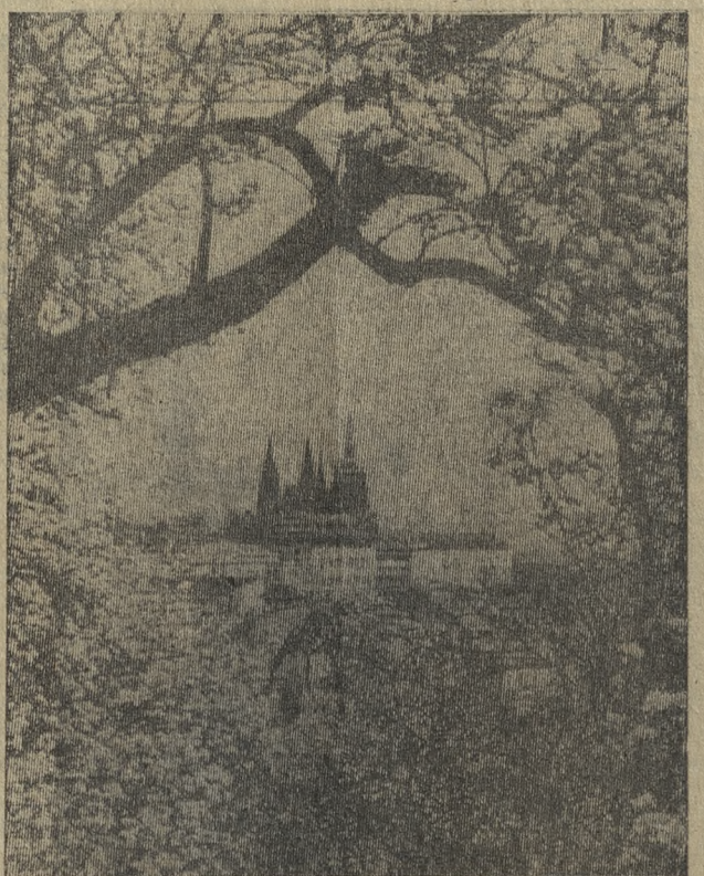
Прага — столица Чехословацкой Социалистической Республики.