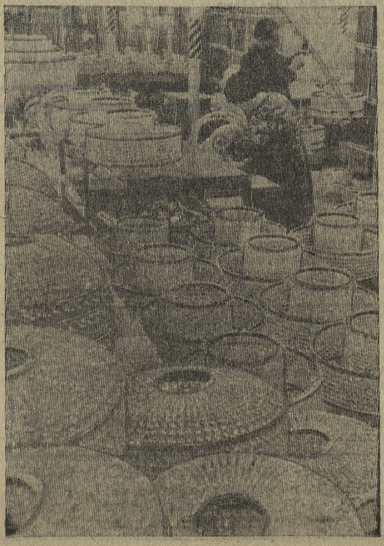
Изделия чешских стеклодувов и стеклоделов славятся во всем мире.