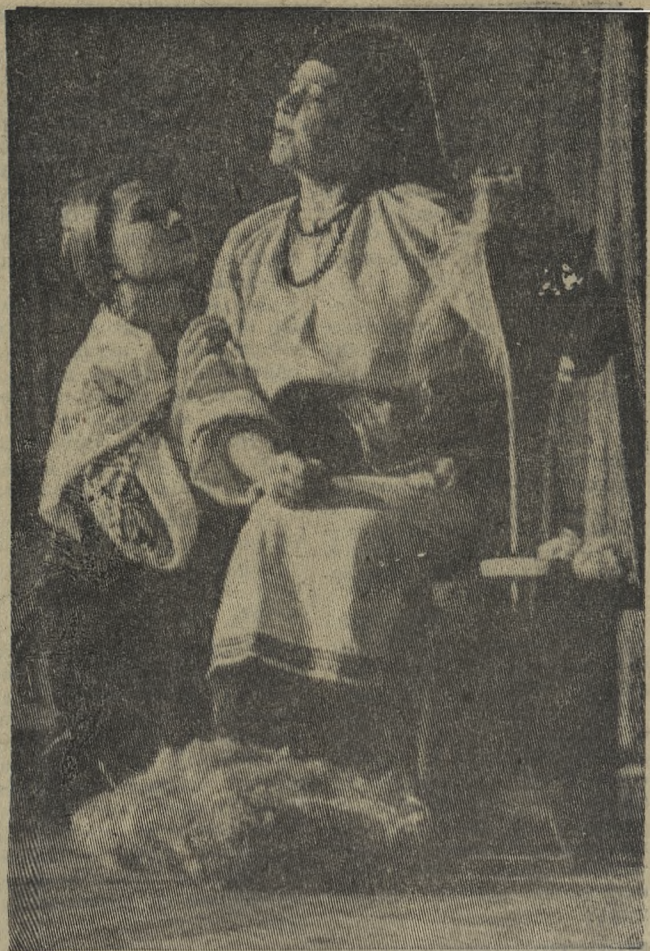
Вчера спектаклем «Цыганка Аза» закончились гастроли Украинского государственного музыкально-драматического театра в нашем городе. Первоуральцы тепло приняли искусство гостей с Украины и, прощаясь, говорили: «До новых встреч!».

На снимке: сцена из народной оперы «Наталка Полтавка».