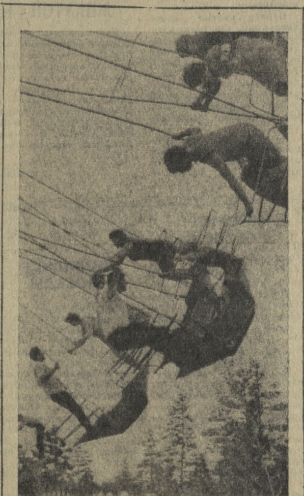
На качелях. В городском парке культуры и отдыха.

Начала работать еще одна летняя база отдыха на 50 мест — «Дружба». Функционируют спортивный павильон и футбольное поле. Закончено составление сметной документации на реконструкцию клуба.