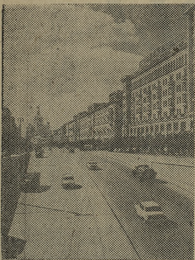
На Большой Садовой улице.