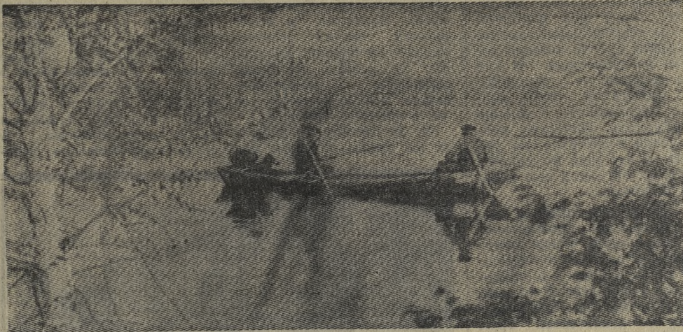
Ранним утром, когда лес, окутанный огромным водоем, еще только просыпается, стоит над водой тишина. Только слышно, как всплескивает рыба, шевеля спокойную водную гладь. Для рыбалки это самое золотое время.