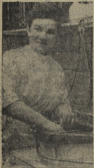
Москва. Один из столичных центров по пересадке органов — Научно-исследовательский институт клинической и экспериментальной хирургии, которым руководит лауреат Ленинской премии академик Б. В. Петровский. Недавно здесь была успешно осуществлена уникальная операция — трансплантация печени.

Двадцатитрехлетняя больная К. была привезена в больницу с инфекционным гепатитом. Болезнь быстро прогрессировала, поврежденные клетки отмирали. Терапевтические средства не помогали и ученые института приняли решение — подключить на время к больной печень животного (при подсадке в настоящее время используется печень свиньи).