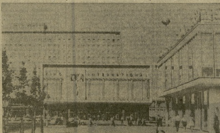
БЕРЛИН СЕГОДНЯ. Гостиница «Беролина», кинотеатр «Интернациональ» и ресторан «Москва» на Карл-Маркс-Аллее.