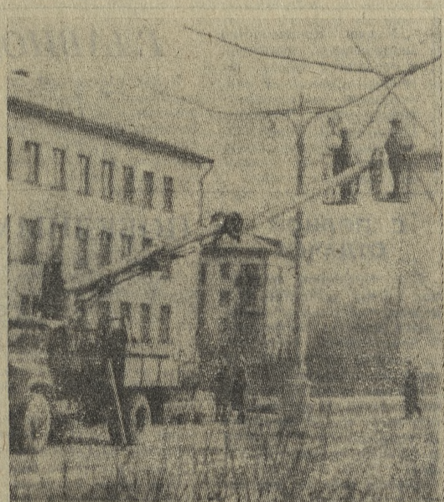
Каждую весну, едва сойдет снег, первоуральцы усыпают, прихорашивают свой город, как хорошая хозяйка к празднику. К маю улицы уже чисты и стволы деревьев побелены, вскопаны клумбы, вычищены светильники, покрашены скамейки. И в этой большой «генеральной уборке» участвуют не только коммунальщики, а и очень многие жители.

Исполком городского Совета выражает уверенность, что руководители предприятий и организаций города, поселковые и сельские Советы при активном участии депутатов примут все меры для осуществления перспективного плана развития коммунального хозяйства и благоустройства нашего города.