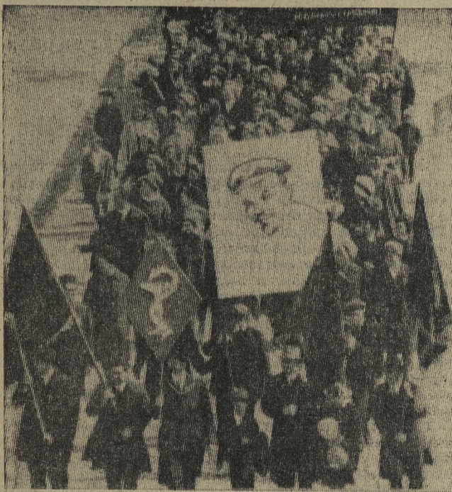
(Окончание. Нач. на 1 стр.)

лично и торжественно появляется многолюдный коллектив орденов Ленина и Трудового Красного Знамени Повотрубного завода. Впереди знамена. Среди них памятные, врученные павечно в честь 50-летия Советской власти и 100-летия со дня рождения Ильича.