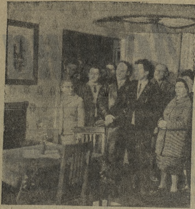
ГДР. В музее В. И. Ленина в начале 1914 года.

Подолгу стоят посетители, рассматривая обстановку комнаты, в которой Владимир Ильич нелегально жил около двух недель в Женеве состоялась международная конференция представителей шести дружбы с СССР различных европейских стран, в которых жил и работал В. И. Ленин. В течение трех дней делегаты из 12 стран, участвовавшие в конференции, выступили с докладами и сообщениями о жизни и деятельности вождя мирового пролетариата.