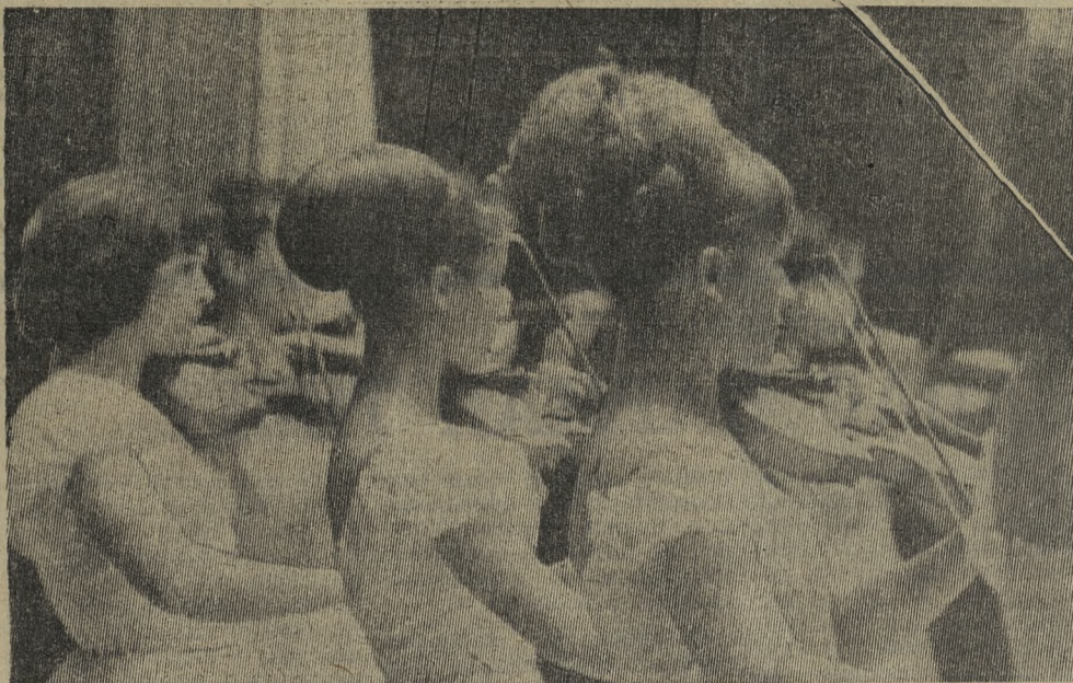
В легких руках скрипачек рождают волшебную музыку тонкие смычки. Совсем недавно женский ансамбль скрипачей Дома культуры Новотрубного завода получил на заключительном смотре художественной самодеятельности области диплом лауреата. И снова репетиции, теперь уже перед большим концертом в честь Ленинского юбилея.

М. ФЕДОТОВ, прокурор завода Первоуральска.